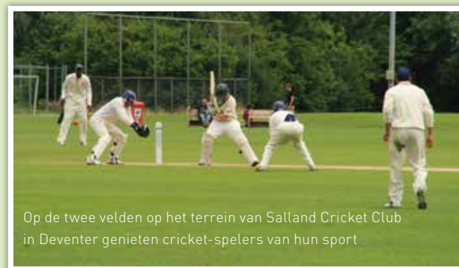
Op de twee velden op het terrein van Salland Cricket Club in Deventer genieten cricket-spelers van hun sport